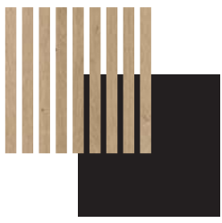
PEPPER OAK BLACK